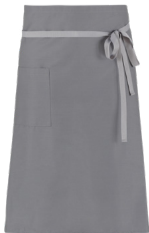
C02 Grigio chiaro