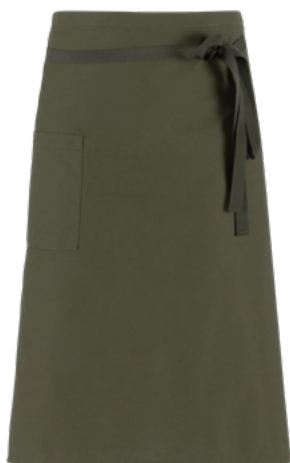
Z43 Military green